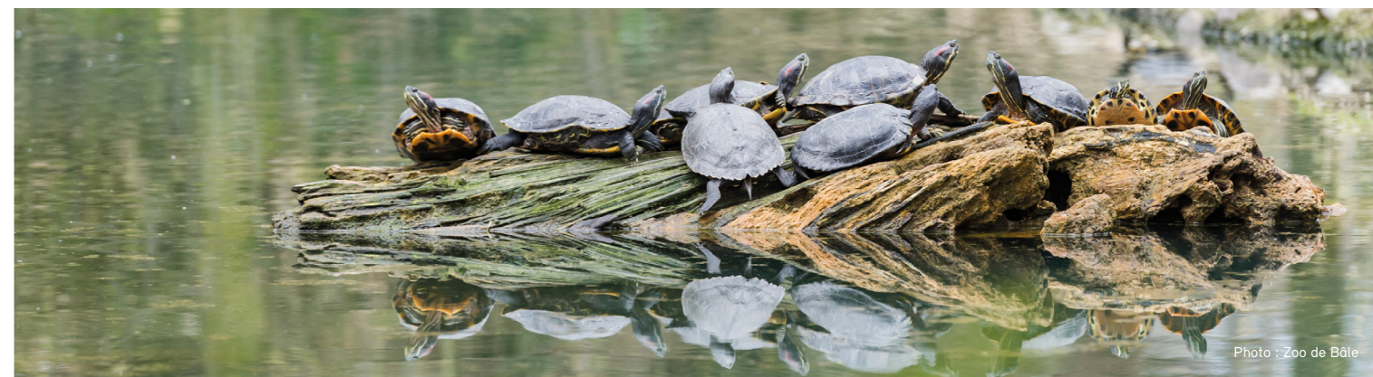
Des tortues de Floride prennent un bain de soleil

Depuis quelques années, de plus en plus de tortues de Floride sont découvertes dans la nature. Quiconque en trouve doit informer les autorités cantonales compétentes. En effet, les cantons disposent de services spécialisés en matière d'organismes exotiques envahissants, parmi lesquels figurent les tortues de Floride. Dans tous les cas, il convient de s'assurer que le reptile est soit transféré dans un établissement enregistré, soit euthanasié.